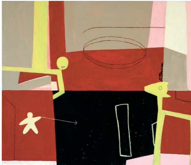
Jagdszene 2008, 130 x 150 cm, Öl auf Leinwand