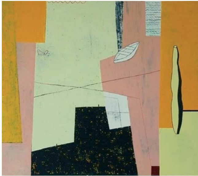
Stilleben mit Boot, 2007, 130 x 150 cm, Öl auf Leinwand